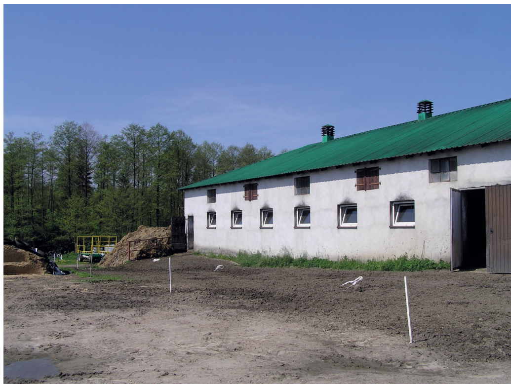
Fot. 2 Widok obory rodziców inwestora, obora krów mlecznych na działce sąsiedniej nr 47/2