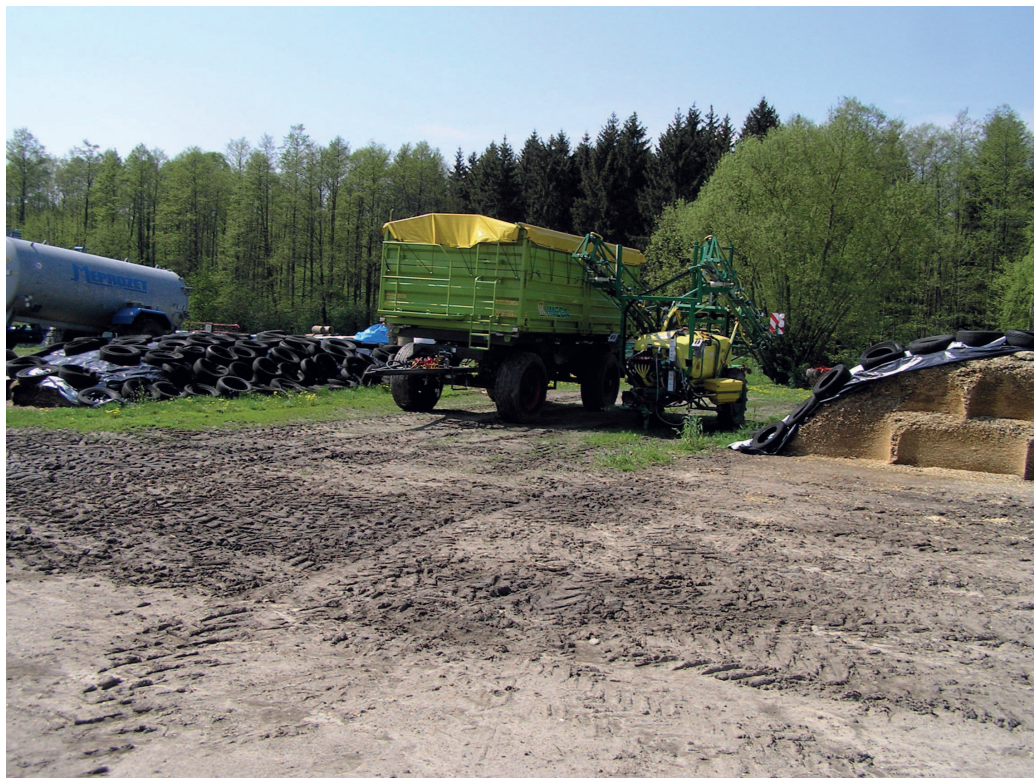
Fot. 1 Widok od strony drogi w kierunku zachodnim, działka 47/3 gdzie powstanie nowa obora.