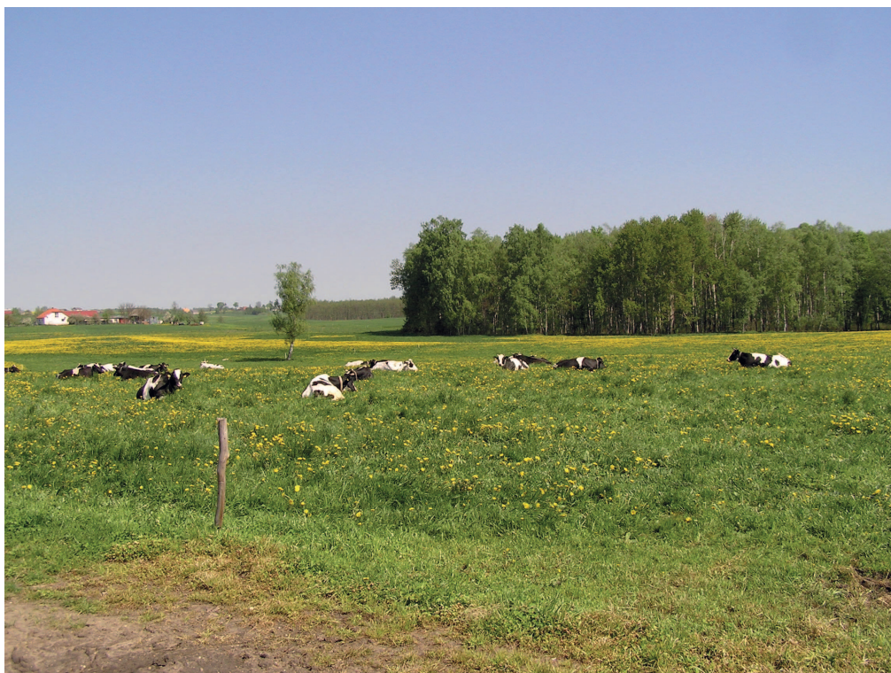
Fot. 3 Widok z drogi na działkę inwestora nr 54/1, położoną z drugiej strony drogi, na której przebywają krowy mleczne Państwa Stanisława i Teresy Tasarz (rodziców), w głębi po lewej zabudowania Wonna 21

Na działce inwestora nr 47/3 obecnie gromadzona jest pasza i słoma dla krów mlecznych, będących własnością rodziców inwestora. Na działce 47/3 przy granicy zachodniej pod lasem przechowywane są maszyny rolnicze (np. pługi, brony, kultywatory itp.).