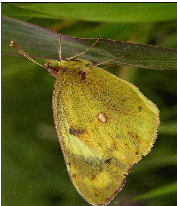
Fot. 27 Szlaczkoń siarecznik ( Colias hyale L.) pospolity gatunek szuwarów i łąk.