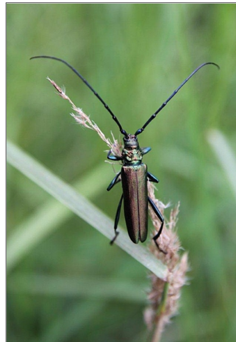
Fot. 28 Wśród zarośli wierzbowych, na powierzchni Piotrowice, występuje okazały przedstawiciel kózkowatych: wonnica piżmówka